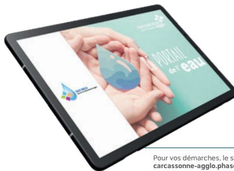
Pour vos démarches, le site : carcassonne-agglo.phaseo.fr

Désormais, en quelques clics sur un espace personnel sécurisé, il est possible de souscrire ou de résilier soi-même un abonnement, de saisir les chiffres de son compteur pour mesurer sa consommation (en cas d'absence lors du passage du releveur), de payer en ligne par carte bancaire, de télécharger ou d'imprimer ses factures, de préciser ou modifier ses coordonnées (postales, téléphoniques, adresse mail) de déclarer un changement d'adresse, ou encore de poser des questions au service concernant la facturation.