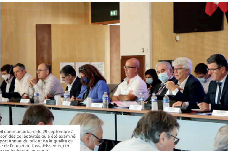
Conseil communautaire du 29 septembre à la maison des collectivités où a été examiné le rapport annuel du prix et de la qualité du service de l'eau et de l'assainissement et voté le pacte de gouvernance.