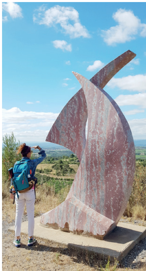
ODY'Slow en Grand Carcassonne vise à développer et promouvoir un tourisme expérientiel, immersif, valorisant les ressources territoriales et l'esprit unique de ces lieux, tout en préservant l'environnement.

locales et l'esprit unique de ces lieux, sont aussi une source d'inspiration pour des sorties autochtones : La Cité et le lac de la Cavayère à vélo et à cheval ; les vignes des Corbières et des sentiers poétiques dans le Val-de-Dagne, à pied, en bus et en co-voiturage ; dans le Minervois, les carrières de marbre rouge, l'abbaye, les bords du Canal du Midi à pied ; l'Aude en paddle ; dans les rues de Montolieu, le village du livre et du musée d'art brut Cères-Franco, toujours à pied ; dans le Cabardès, à la découverte des Capitelles et du village d'Aragon en VTT.