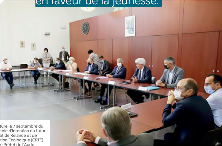
Signature le 7 septembre du protocole d'intention du futur Contrat de Relance et de Transition Écologique (CRTE) avec le Préfet de l'Aude.