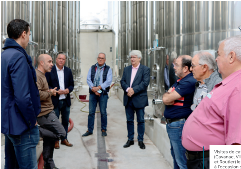
Visites de caves du territoire (Cavanac, Villesèquelande et Routier) le 27 septembre à l'occasion des vendanges.