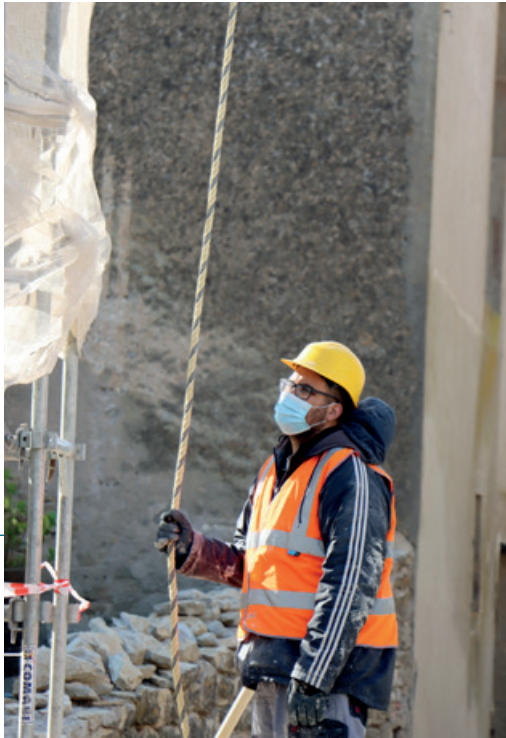
À Villarzel-Cabardès, l'équipe du chantier d'insertion a redonné une seconde jeunesse aux murs de pierres des ateliers municipaux.

Chaque année, une vingtaine de personnes en difficulté bénéficient, grâce à Carcassonne Agglo Solidarité, d'un contrat dans le cadre d'un des deux chantiers d'insertion : « petit patrimoine » ou « éco-citoyen ». Le CIAS est mandaté pour 9 postes concernant le premier et pour 8 concernant le second. L'objectif premier est bien le retour à l'emploi de bénéficiaires du RSA, de personnes aiguillées par Pôle Emploi (chômeurs longue durée) ou les missions locales (pour les moins de 26 ans).