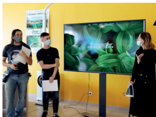
Les élèves de Simplon, participent à l'action « Quand le numérique rend service à l'environnement » le 28 septembre dernier.

La prochaine formation « Technicien supérieur système et réseaux (TSSR) » se déroulera du 14 décembre 2021 au 10 novembre 2022, à Kappa[R]. Les inscriptions sont ouvertes sans prérequis.