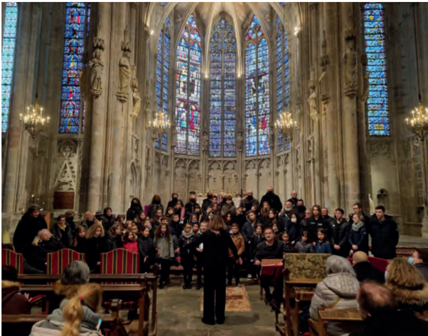
Concerts de « Despertant instruments adormits » à la Basilique Saint-Nazaire de Carcassonne.