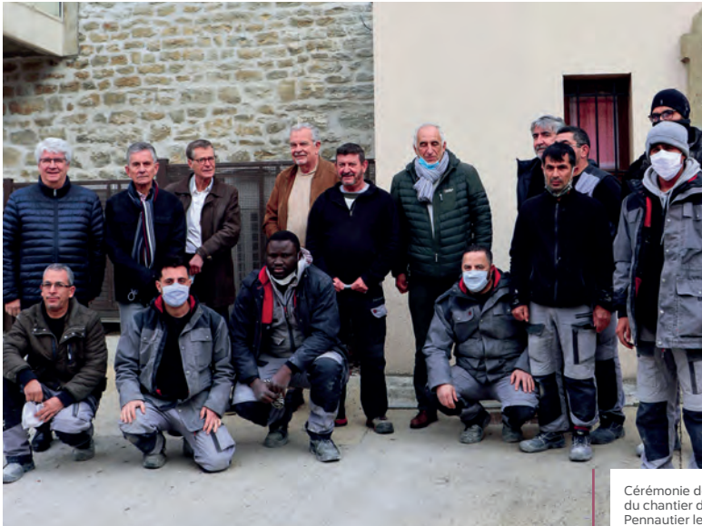
Cérémonie de fin de travaux du chantier d'insertion de Pennautier le 1 er décembre