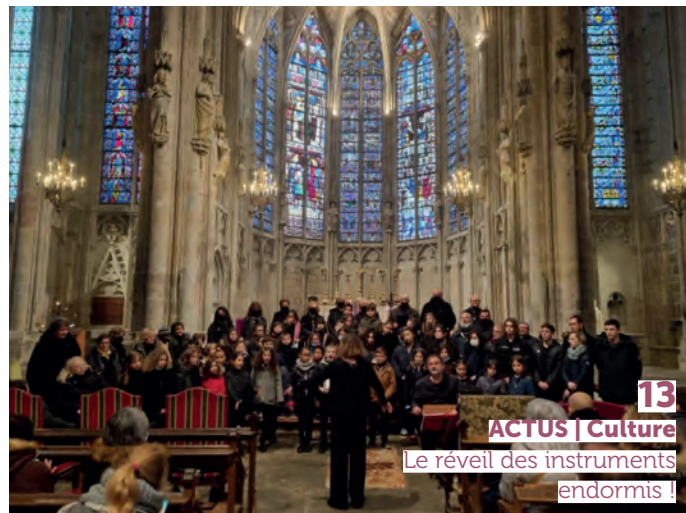
13 ACTUS | Culture Le réveil des instruments endormis !