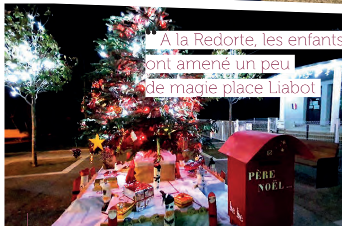
A la Redorte, les enfants ont amené un peu de magie place Liabot