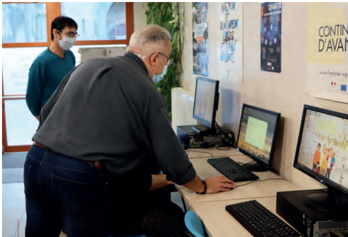
Un point de médiation numérique est également proposé à l'EVS.