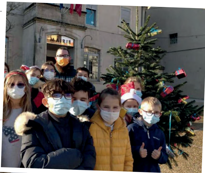
À Alzonne, les enfants de l'Alaé ont décoré les sapins de Noël du parvis de la mairie.

Les vacances de fin d'année sont l'occasion pour les enfants de profiter des activités proposées par les accueils de loisirs de Carcassonne Agglo. En cette année difficile, plusieurs d'entre eux ont proposé d'allier loisirs et solidarité pour ne pas oublier les plus en difficultés. Retour sur 3 d'entre eux.