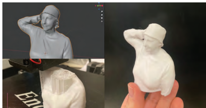
Le parcours d'initiation au scan 3D et à l'impression 3D, se déroulera du 21 au 23 février à la Fabrique des Arts puis au Fab Lab d'Alpha[R]