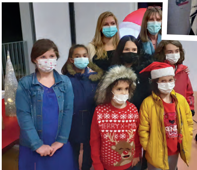
A Ventenac, les enfants de l'Alaé ont confectionné 65 boîtes de Noël solidaires.