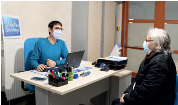
Parmi les actions de l'EVS : un accompagnement administratif pour les habitants.

Depuis la mi-décembre, l'espace de vie sociale créé par Carcassonne Agglo rassemble les quartiers de la Bastide et du Pont-Vieux autour de la volonté d'être plus proches de leurs habitants et d'améliorer leurs conditions de vie en partenariat avec la CAF11. Reportage.