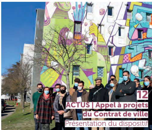
12 ACTUS | Appel à projets du Contrat de ville Présentation du dispositif