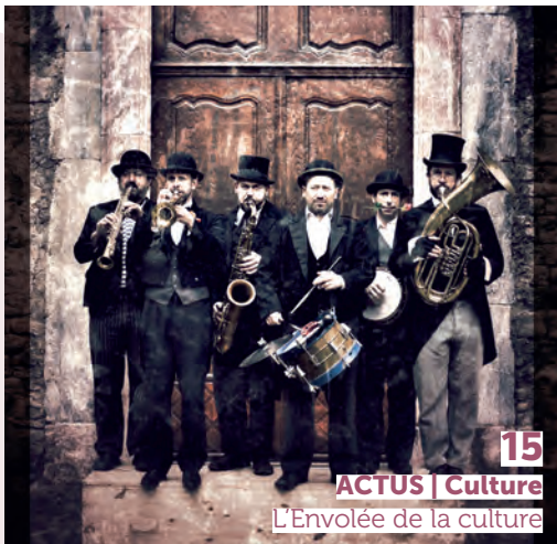
15 ACTUS | Culture L'Envolée de la culture