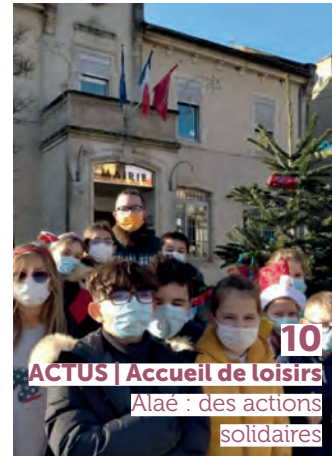
10 ACTUS | Accueil de loisirs Alaé : des actions solidaires