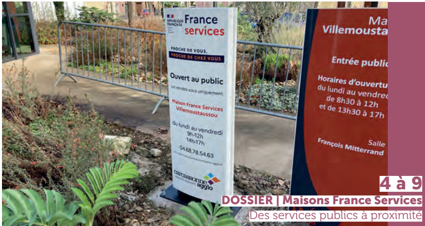
4 à 9 DOSSIER | Maisons France Services Des services publics à proximité