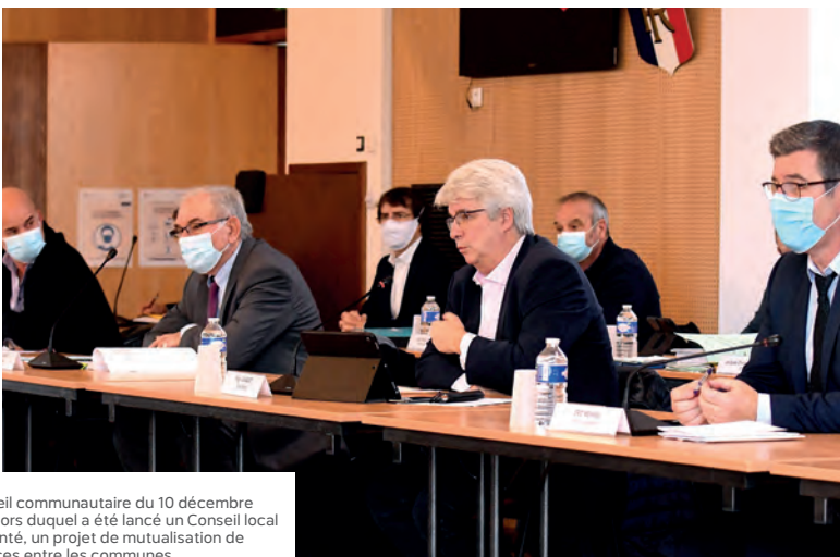
Conseil communautaire du 10 décembre 2021 lors duquel a été lancé un Conseil local de santé, un projet de mutualisation de services entre les communes...