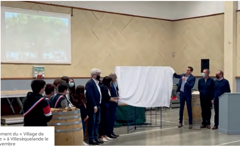
Lancement du « Village de l'Arbre » à Villesèquelande le 27 novembre